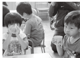
▲お茶を飲む町立わかば保育園の園児たち。

5月14日、児湯郡茶農業協同組合と高鍋町茶業振興会は、町内の保育園や小学校など12カ所に児湯産の緑茶のティーバッグ約5万個を寄贈し、町立わかば保育園で贈呈式が行われました。