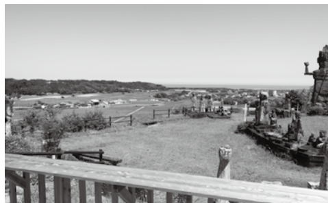
▲ウッドデッキからは日向灘と高鍋の田園風景が一望できます。