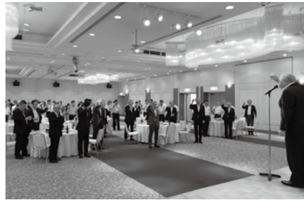
▶ホテル四季亭での脱コロナ決起大会の様子