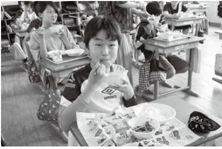
▶給食を食べる高鍋東小学校の生徒たち

5月22日に高鍋東西小学校、5月28日に高鍋東西中学校で宮崎牛を使用した給食が提供されました。 新型コロナウイルス感染症感染拡大による消費減少を受け、給食に地元食材を取り入れる県緊急対策事業の一環で行われました。 高鍋東小学校では肉じゃがが提供され、子ども達は笑顔で給食を楽しみました。 今後、宮崎牛や地鶏などの県産食材を使ったメニューを提供する予定です。