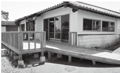
▲ウッドデッキが設けられた高鍋大師堂。