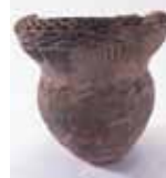
縄文土器 (高鍋町下耳切第3遺跡)