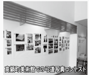
高鍋町美術館での弓道写真コンテスト