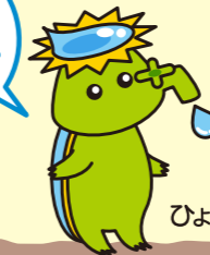
ひょうびっちゃん