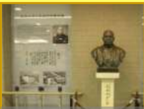
大阪市浪速区にある愛染橋病院の玄関を入ると、石井十次の銅像ととも茶臼原憲法や沿革があります。病院は地下鉄堺筋線「恵美