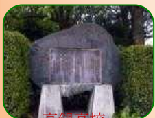
高鍋高校 前庭に建つ詩碑

人間はその境遇によって 教育せらるるものとせば 爾高鍋よ 爾は予が 理想的人物を養成するに於いて 最も適當のところなり