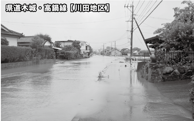
県道木城・高鍋線【川田地区】