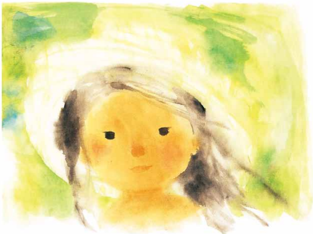
緑の風のなかの少女