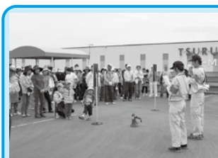
今年から避難ビルとして指定されたT-MAX高鍋店。今回は、4地区がこのビルを使って訓練を行った

九州南部の梅雨入りが発表された直後に発生した大雨の影響で、高鍋町では床上浸水六棟、床下浸水五十一棟、また土砂崩れや農作物の被害が発生しました。また、大雨による土砂災害の危険性が高まったとして、一部の地域では避難勧告が発令されました。 これから本格的な台風到来シーズンを迎えます。水害だけでなく、自然災害から命を守るための大切なポイントを紹介しましょう。 ポイント① 地域のつながりを大切に 自然災害が発生し、一刻を争う事態が起こったとき、お互いに情報を伝達し、助け合える地域の人たちとのつながりは、自分や家族の命を救う大きな力となります。また、そのつながりは、被害の拡大を最小限に抑えることができます。 ところで、皆さんは「自主防災組織」のことをご存知ですか？ 自主防災組織とは「自分たちの地域は自分たちで守る（自助・共助）」という意識のもと、地域住民によって任意に結成された防災組織のことです。 現在、高鍋町には十四の自主防災組織があり、その数は年々増加しています。すべてが自治公民館を母体とした地域から成り立っており、いつ災害が発生しても冷静な対処ができるよう、定期的な訓練や危険箇所点検、会議などを行っています。防災意識の向上を図っています。