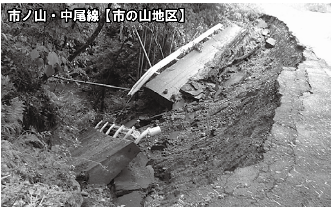
市ノ山・中尾線【市の山地区】

6月4日、県北を中心に突然襲った集中豪雨。この大雨により高鍋町では一部の地域で床上・床下浸水、土砂崩れなどの災害が発生しました。このような予測できない災害から身を守るために、私たちは日ごろからどのような防災対策をすればよいのでしょうか。