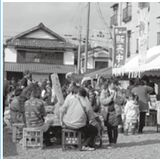
商工会議所青年部などが出店した店舗が軒を連ねた

2月11日、「商人フェスタ2015」がたかなべ町家本店東側広場で行われ、終日、多くの買い物客でにぎわいました。