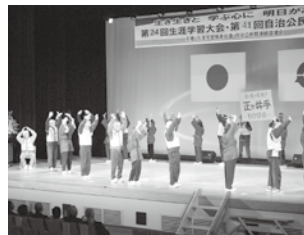
元気いっぱい、笑顔で「長生き音頭」を披露する正ヶ井手地区「わかば会」の皆さん

2月22日、第24回高鍋町生涯学習推進大会、第41回高鍋町自治公民館大会が高鍋町中央公民館で行われました。事例発表や地域貢献に尽力した方々の表彰、ドライ・アップ・ジャパンの瀬川氏による講演など、生涯学習や地域交流の大切さを学ぶ大会となりました。