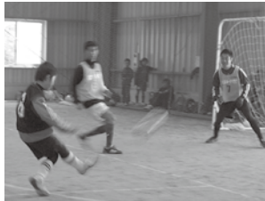
小学生から大人までの5人制で、世代を超えたチーム力で戦ったミックスフットサル

2月1日、「第1回高鍋スポーツフェスティバル」が高鍋町小丸河畔運動公園で行われました。この日はバレーボールコンテスト、2時間耐久リレーマラソン大会、ミックスフットサル、スロージョギングの4競技を開催。町内から約150人が参加し、心地の良い汗を流しました。