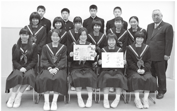
リーフレットとマップを持って町役場に訪れた高鍋東中学校の生徒の皆さん

生徒たちの思いの込められたリーフレットとマップ、ぜひ手に取って、ゆっくりご覧くださ