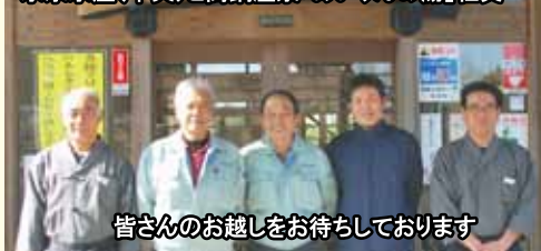
皆さんのお越しをお待ちしております