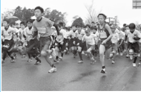
スタートの合図とともに勢よく駆け出す参加者

3月1日、「第41回舞鶴ロードレース大会 in ルピナス」が宮崎県立農業大学校・ルピナスパークで行われました。小雨の降る肌寒い中で行われた大会でしたが、517人の参加者はゴールを目指し、力強い走りを見せてくれました。