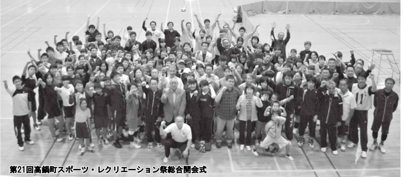
第21回高鍋町スポーツ・レクリエーション祭総合開会式

最近、カラダを動かして心地よい汗を流していますか？ カラダを動かすと肉体的だけでなく、精神的にも非常に良い効果があります。 スポーツの秋！カラダを動かして、心身ともにリフレッシュしましょう！