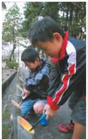
高鍋城灯籠まつりは、実行委員会メンバーをはじめ、多くのボランティアの皆さんによって支えられ、開催されています。その皆さんに心から感謝しながら、活動の軌跡を写真で紹介します。