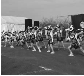
毎年恒例 町立保育園 年長児による「白雲の城」

十月十日〜十一日、舞鶴公園周辺で第九回高鍋城灯籠まつりが行われました。高鍋農業高校グラウンドに多くのボランティアの皆さんによって描かれた五千基の灯籠による高鍋町の地図は、壮大で幻想的な雰囲気を感じさせてくれました。また、姉妹都市や町内の団体による物産店やステージイベントも多数あり、多くの町民で賑わいました。 ※灯籠写真は八ページに掲載。