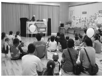
ボランティアグループ「さつき会」による人形劇を熱心に観る来場者の皆さん

◎見違えるほど鮮やかに! 十月に、県立産業技術専門校高鍋校塗装科の皆さんが、実習を兼ねて小丸河畔運動公園野球場の塗装を行っていただきました。ピカピカになったこの野球場で、新たな感動のドラマが数多く生まれることを期待します。