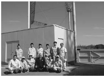
丁寧な塗装学習により野球場を立派に蘇らせてくれた皆さん

◎見違えるほど鮮やかに! 十月に、県立産業技術専門校高鍋校塗装科の皆さんが、実習を兼ねて小丸河畔運動公園野球場の塗装を行っていただきました。ピカピカになったこの野球場で、新たな感動のドラマが数多く生まれることを期待します。