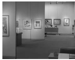
版画をはじめ絵画・彫刻・書と作者の魅力がギュッと詰まった展覧会

◎子どもの育ちにエール 十一月一日、健康づくりセンターで子育て応援フェスティバルが行われ、約六百人の親子連れが訪れました。赤ちゃんハイハイ競争では、親の元へ懸命に向かう子どももいれば、泣いて一歩も進まない子どももいました。どちらにしても、とても愛らしく、会場が笑顔いっぱい、和やかな雰囲気に包まれました。