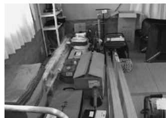
整備された設備の一部