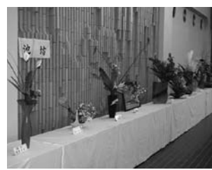
会場である中央公民館の入口を華やかに彩ってくれた華道展示

◎肌で感じた異文化 十月十二日、総合体育館で国際親善空手道大会が行われました。ホームステイや練習の場でオーストラリアの選手と触れ合った高鍋の子どもたちは、身近に異文化を感じられる貴重な体験をしたようでした。