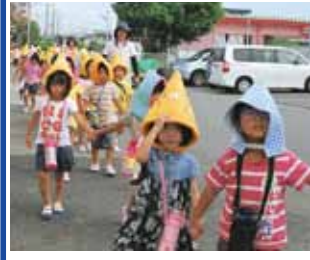
園児たちは少し緊張した表情を見せたが、予定より数分早く避難場所へ到着した

九月十日、町立わかば保育園で地震と津波による被害を想定した避難訓練が行われました。園児たちは、防災ずきんを被り、手をつないだり、ロープを握りながら、足早に九州電力高鍋営業所の三階まで避難をしました。