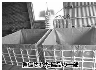
整備された備品の一部