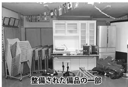
整備された備品の一部