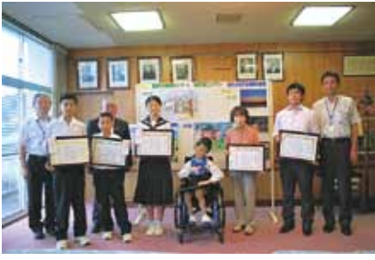
表彰式では、受賞者の皆さんが応募した絵や写真の風景について思いを話した