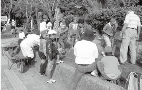
10月17日 東区コミュニティ・スクール「学習環境支援プロジェクト」の取り組みの一つとして、東小学校でボランティアと一緒に花壇整備が行われた