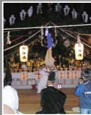
宮崎県指定無形民俗文化財