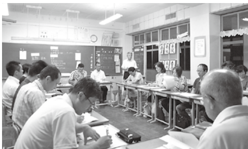
東区学校実務者会議の様子。保護者・地域・学校からそれぞれ意見が出され、活発な協議が行われた