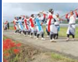
この棒踊りの様子は、宮崎ケーブルテレビで12月15日～平成26年1月14日までの期間、放送が予定されています。

十月七日、嶋野地区に伝わる駄祈念祭で棒踊りが奉納されました。約二百五十年前から、今日に至るまで引き継がれている踊りを見るために、保育園児や地域の皆さんをはじめ、串間市の鎌踊り保存会の方も訪れていました。