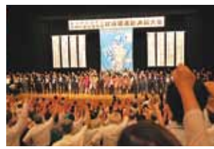
会では、一刻も早い道路の整備に向けて、宮崎県民の気持ちの結集を呼びかけた

九月二十六日、延岡市で行われた東九州自動車道、九州中央自動車道建設促進総決起大会に高鍋町から参加しました。救急医療活動の支援や経済の活性化などのため、熊本県や大分県までの道路の早期建設、整備が望まれています。