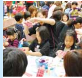
折り紙などを使って小物を作る手作りひろばでは、多くの親子の笑顔が見られた

十月二十七日、高鍋町健康づくりセンターで、子育て応援フェスティバルが行われ、約千八百人の親子連れなどにぎわいました。