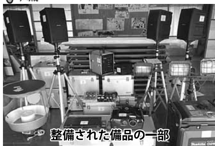
整備された備品の一部