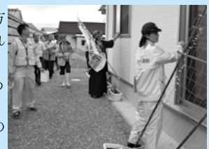
宮越地区で行われた鍵かけ合戦では、家や車、自転車の施錠状況を確認した