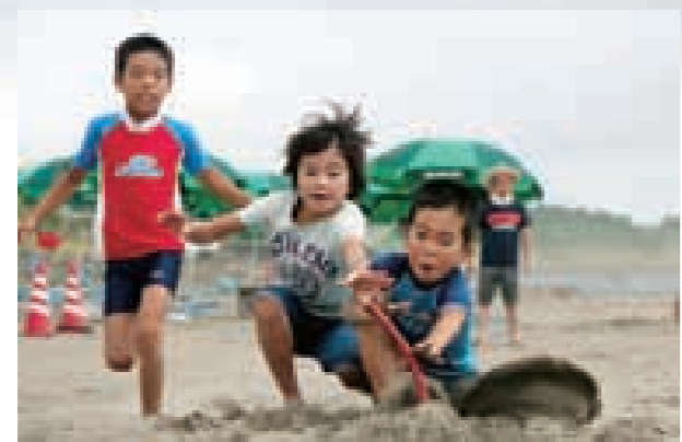
ビーチフラッグ大会 数人で1本のフラッグを目指して走り、誰が先を取るかを競走します。大人も子どもも気軽に参加できる人気の大会です。