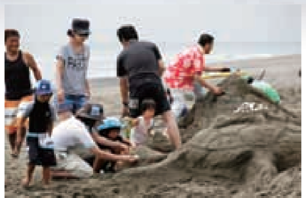
砂の造形コンテスト 家族やグループなどがチームを組み、砂で思い思いのを作ります。みんなで協力し合って思い出に残るものを作ろうと一生懸命。力作が並びます。