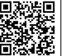
▲ホームページはこちら

売却代金は滞納となっている税などに充てられ、公共サービス提供のための自主財源になります。 ▲入札 令和4年3月7日（月）午後2時半～午後3時 ▲開札 同日午後3時01分 ▲ところ 高鍋町役場庁舎別館1階 会議室 ※農地の入札には事前に手続きが必要になりますのでご注意ください。 ※詳しくは、町ホームページまたは収納係（☎26-2012）へ。