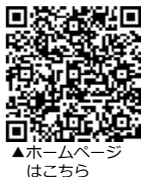
▲ホームページはこちら

地域での防災活動の中核となる人材養成のため「宮崎県防災士養成研修」が実施されます。 ◎基礎コース(1日間)：7月～8月 ◎専門コース(2日間)：12月～令和5年1月 ▲受講料 資格試験受験料3,000円および防災士資格認定登録料5,000円が必要です。 ▲申し込み 申込用紙を総務課に提出。申込用紙は、総務課窓口または町HPで入手できます。 ※町内在住者は、全額助成する制度があります。詳しくは、生活安全係(☎26-2022)へ。