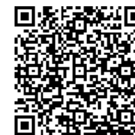
▲ホームページはこちら

町で使用しなくなった車両および物品を現状のまま一般競争入札にて売却します。物件等の詳細につきましては、町ホームページをご確認ください。 ▲申込締切 6月22日(水) ▲入札締切 6月29日(水) ▲開 札 6月30日(木) ※入札には事前に入札参加申込書の提出が必要になります。詳しくは、契約管財係(☎26-2002)へ。