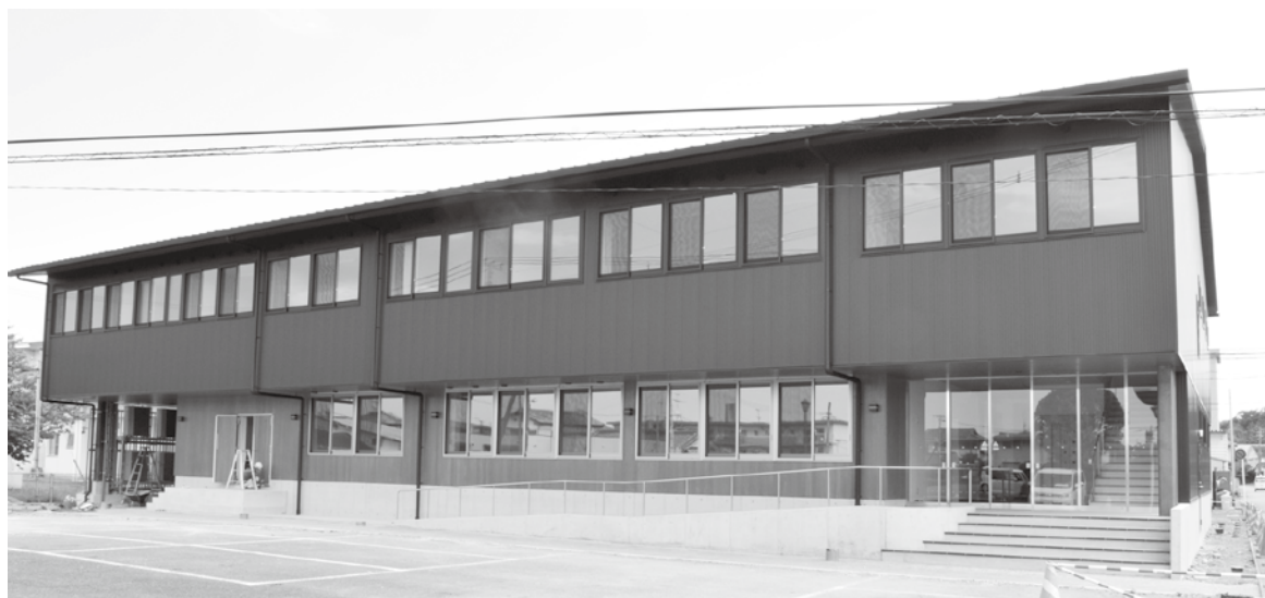
▲高鍋商工会館の外観

一方、デメリットとして、建物が町の所有でないため、将来的に建物の拡張ができないことや、執務室内に設備を設けようとした場合に、高鍋商工会議所の許可を得なければならないことなどが挙げられますが、建物の設計に町の意向を含んでいた、だいたいことや、高鍋商工会議所に対し、将来的な変化に柔軟に対応していただけるようお願いし、理解を得ているなど、極力、デメリットを解消できるよう努めたところです。