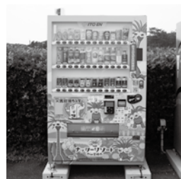
▲蚊口浜のポケモン自販機

ポケモンの自動販売機は蚊口浜に1つと高鍋駅に1つあります。宮崎県の推しポケモンであるナッシーやアローラナッシーが描かれています。ポケモンが描かれた自販機ってなかなか珍しいですよ!驚いたのがPayPayやLINE Payなどにも対応しているところです(もしかして、最近の自販機では当たり前なんでしょうか...?)。ちょうどポケモン自販機を見に行ったとき財布がなかったんですが、スマホを持っていたので無事に買うことができました!蚊口浜の自販機はポケふたの近くにあるので、気になる方はぜひ行ってみてください!