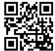
↑ 高鍋町ホームページ