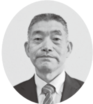
坂本 地踊り保存会 〈坂本〉