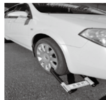
▲タイヤロックによる車の差し押さえの様子

差し押さえた動産は、公売により売却し、売却代金を滞納している税等へ充てます。土地や家屋の不動産を所有している方が滞納した場合、不動産についても差し押さえて公売を行っています。税務課窓口で毎月開催している窓口公売をはじめ、平成30年度は次の公売会に出品しています。