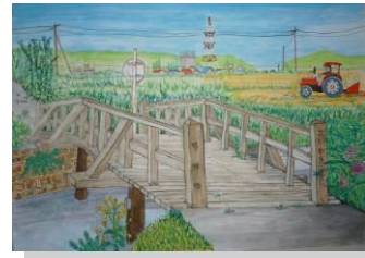
第1回 高鍋町景観絵画コンクール 入賞作品

わがまち高鍋町は、県の中央部に位置し、海や山に囲まれた美しい自然あふれる町で、古くから「歴史と文教の町」としての伝統のある町です。