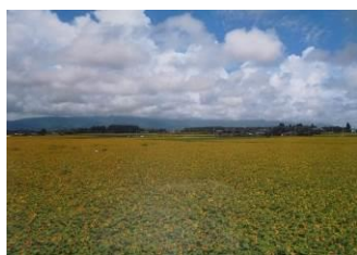
第1回 高鍋町景観写真コンテスト 入賞作品