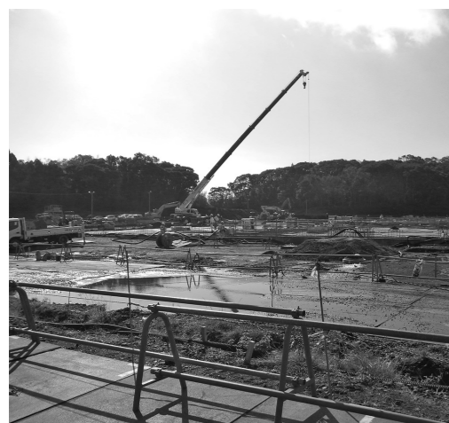
宮崎キャノン工場 基礎工事完了