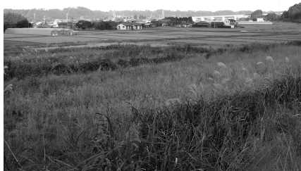
『整備を計画している圃場』