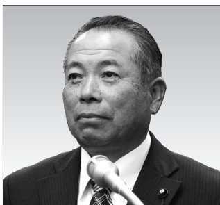
ひだか まさのり 日高 正則 議員

福祉課 子ども食堂の運営においては、フードバンク事業との連携は大変有効と思う。子ども食堂が、高齢者の方たちとの交流の場、居場所としても重なれば、地域活性化につながっていくと考えている。