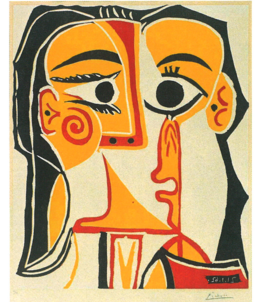
パブロ・ピカソ《女の顔》1962年 特別展 ピカソ 版画に魅せられた巨匠— © 2026 - Succession Pablo Picasso - BCF (JAPAN)