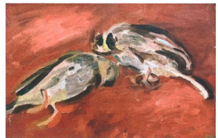
塩月桃甫《雀》制作年不明