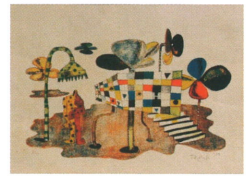
加藤正《風が止った》1957年