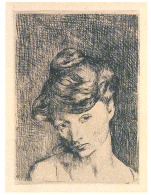
パブロ・ピカソ《女の顔》1905年 © 2026 - Succession Pablo Picasso - BCF (JAPAN)