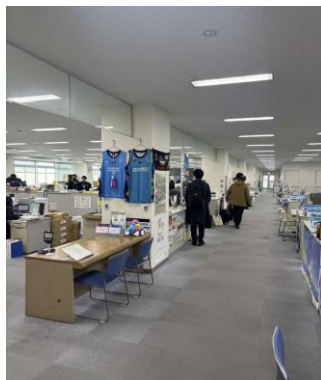
唐津市実行委員会事務局