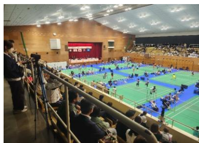
バドミントン競技会場の様子