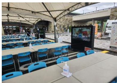
大会参加者休憩所