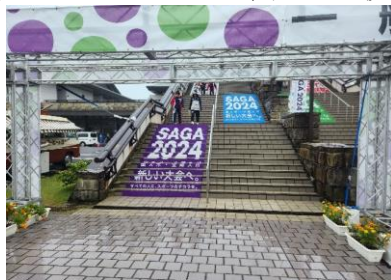
唐津市文化体育館装飾