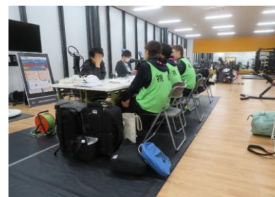
大津市国スポ担当者との協議