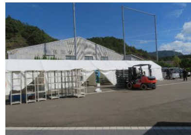
有田赤坂球場競技会場設営の様子