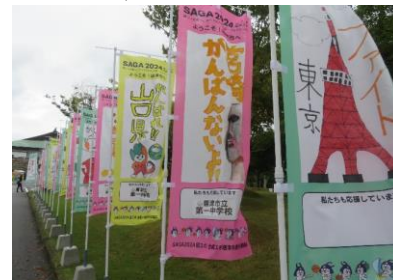
小中学生による応援のぼり旗