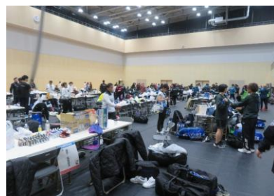
選手控所(サブアリーナ)