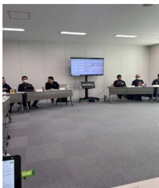
先催都市からの引継及び意見交換