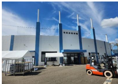
有田町有田赤坂球場(軟式野球会場)