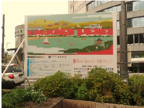
【駅外観 (出入口装飾)】