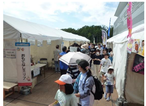
【ふるまい(リーフパイ)】