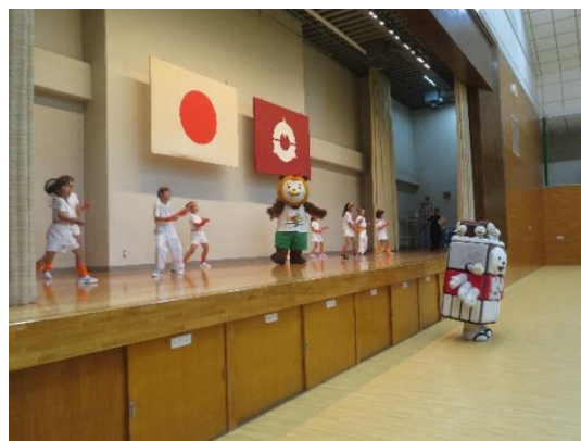
【みやざき犬PRキャラバン】