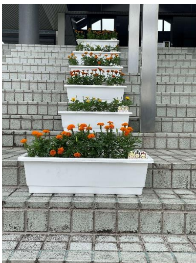
【花リレー試験栽培】