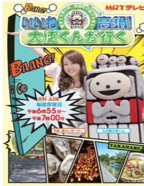
いいね高鍋! 大使くんが行く

▲と き 11月10日（日）午前8時から（1時間程度） ※小雨決行。 ▲集合場所 蚊口海浜公園管理棟前広場 ※詳しくは、西都児湯森林管理署（☎43-1377）へ。