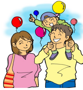
子育て応援フェスティバル 10月25日（日）

◎高鍋町健康づくりセンターイベント（十月二十五日）開催のお知らせ ◎プール無料開放…午前10時～午後5時（受け付け…午後四時まで） ◎プール体験教室…①水中運動 午前十一時～十一時三十分 ②サイバーホイール（四歳以上一回…百円）午後一時～四時 ◎ノルディックウォーキング（無料）…午前十時～十時三十分 ※センター周辺を歩きます。（雨天時は高鍋町体育館） ◎床運動…①ヨガ 午後三時～三時三十分 ②親子エクササイズ 午後三時三十分～三時五十分（小学校低学年以下と保護者） ◎健康チェック（無料）…午前十時～午後三時 血圧・体脂肪・血管年齢・骨密度の測定・健康相談 ※詳しくは、高鍋町健康づくりセンター（☎23-2323）へ。