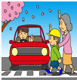
春の全国交通安全運動 4月6日（水）～ 15日（金）