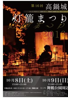
高鍋城灯籠まつり

十月は農業者年金加入推進月間です。農業者年金制度は、農業者の老後生活の安定や福祉の向上のために国民年金の上乗せ年金としてあるものです。額二万六千円に決まらず、加入ができません。①農業者の方なら広く加入ができません。②少子高齢時代に強い積立方式の年金です。③保険料の額は自由(月八歳までの保証がついた終身年金です。④保険料の全額社会保険料控除など税制面の優遇措置があります。⑤八歳までの保証がついた終身年金です。⑥認定農業者など保険料の国庫補助があります。