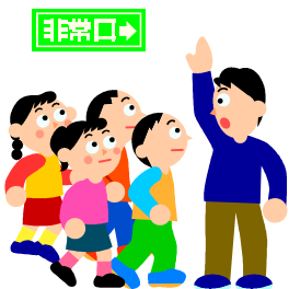
9月1日は防災の日です

◆8月は、町県民税2期・国民健康保険税2期の納付月です。納め忘れがないようお願いします。