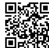
↑地域おこし協力隊サイト