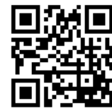
↑高鍋町ホームページ